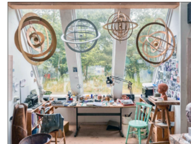
‘Armilar’. Mobiler i birkefiner. 2017.

Lad disse opløftende ord afrunde artiklen om en usædvanlig stærk, skrap, skarp, sensitiv og slagfærdig sandsigerske, som står ved sine meningers mod.