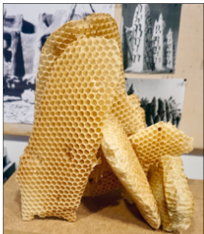
'Fribyg'. Skabt ud fra biernes bo. 2017.