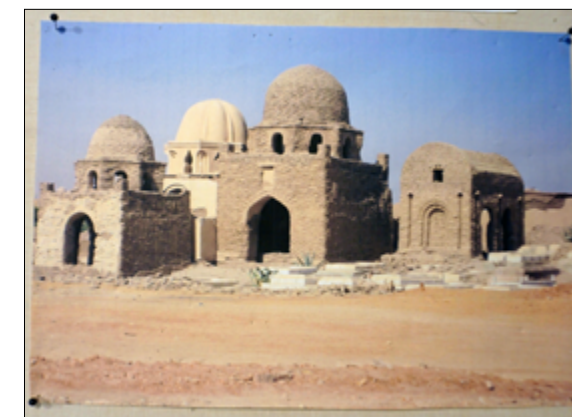
Syriske helligdomme. Gerdas udklip fra 1985.

For vi er alle først og fremmest mennesker med de samme behov, sorger, glæder og følelser. Vi fødes