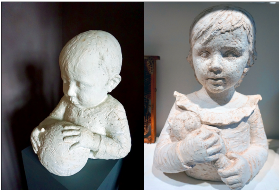
‘Alfred med verden’. Gips. 2003.