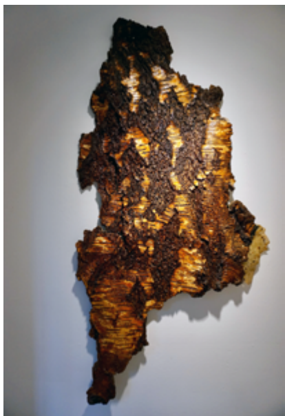
Relief af imprægneret birkebark. 2012.