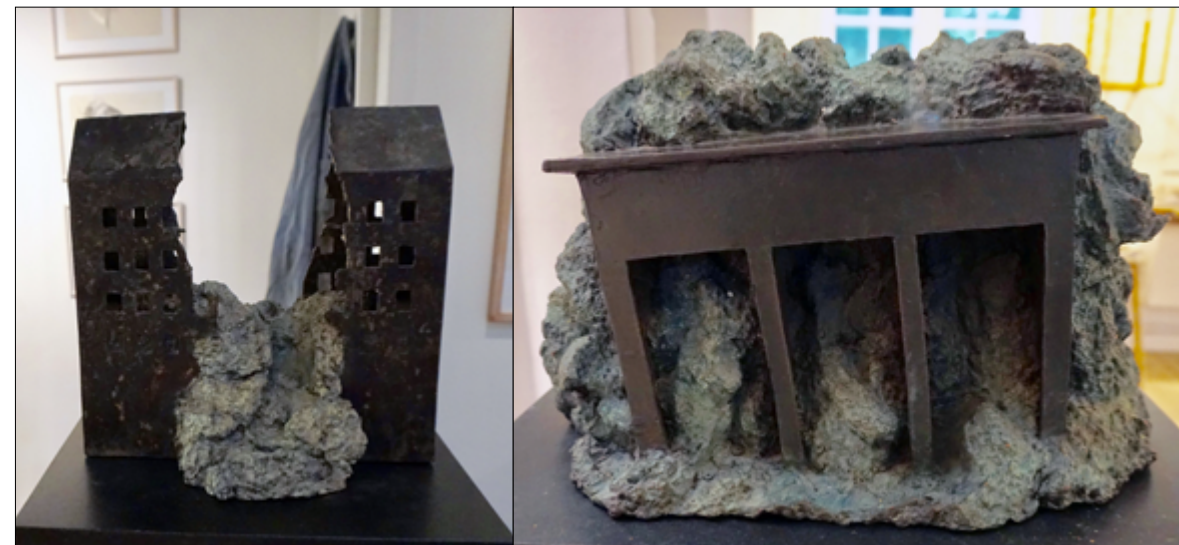
'Metastase'. Bronze.

Langt de fleste af Gerdas værker er skabt ud fra et indgående kendskab til og utrættelig optagethed af verdenshistorien, de store kulturer og religioner, arkitektur, menneskelige vilkår før og nu, tragedier, kærlighed og personlige forhold.