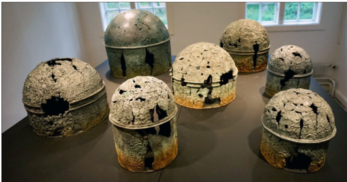
'Kupler - Dome or Die'. 2006.

Hun ønsker at afspejle sin personlige frygt for klodens fremtid på grund af de menneskeskabte katastrofer, som krig og klimaforandringer medfører.