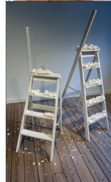
'Selvportræt' 2015.