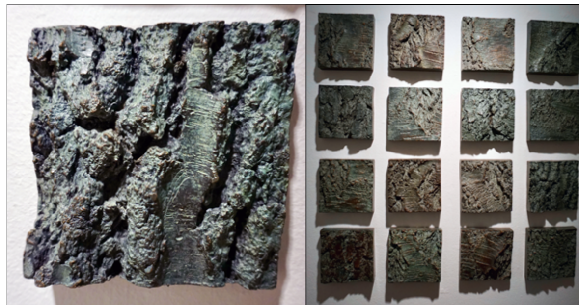
'Skin of the Earth' 2012. Bronze.

Overfladerne kunne minde om brudstykker af jorden set fra himlen med sænkninger, bjerge, vandløb etc.