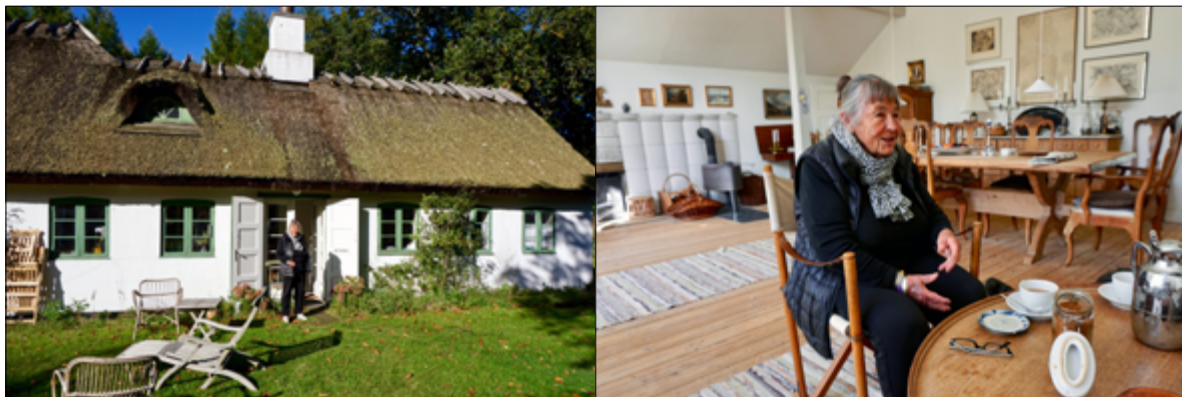
'Kjædemosehuset' oktober 2017.

De fleste af hendes remedier og værker blev i oktober 2017 udstillet meget levende på Munkeruphus Kunstmuseum med titlen: 'Gerda Thune Andersen. Værk og værksted II'.