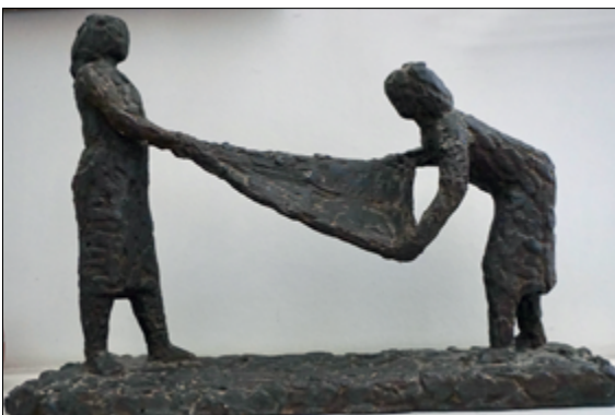
Lille model af 'Vaskepigerne'.